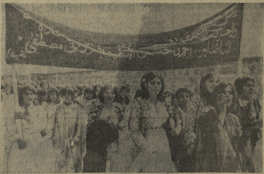
Народ Иранской Республики — арабы и курды — радостно встретили традиционный курдский праздник ноуруз. Этот день в стране отмечается как национальный праздник.

Республиканским декретом ноуруз провозглашен национальным праздником всего Ирана. Это одно из проявлений соглашения об урегулировании курдской проблемы, положившего конец многолетней братоубийственной войне между арабами и курдами на севере страны.