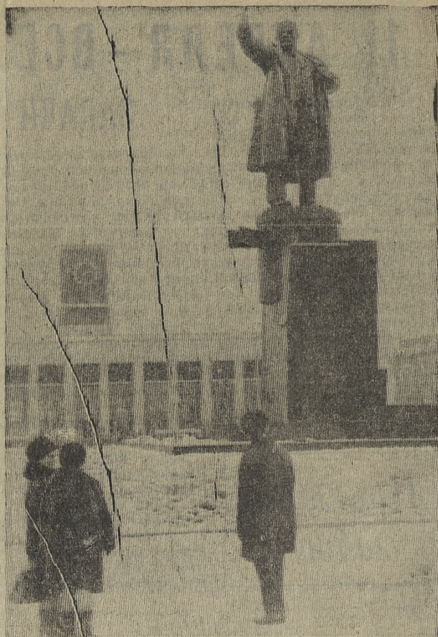
На темы морали

Л. НЕЗЛОБИН, мастер хромпикового завода.