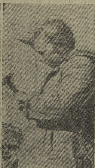
5 АПРЕЛЯ — ДЕНЬ ГЕОЛОГА

На снимке: новый усовершенствованный аппарат «Холод-2Ф».