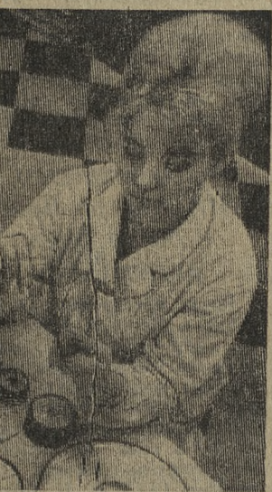
ЛЕНИНГРАД. В два раза увеличит выпуск инструмента из эльбора в этом году ленинградский завод «Ильич».