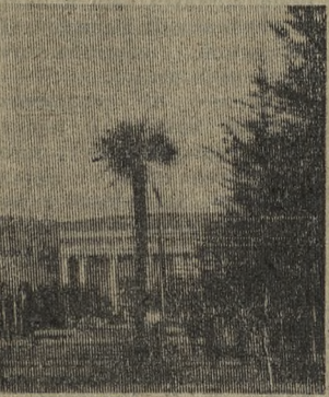
ГРУЗИНСКАЯ ССР. Свыше 120 тысяч человек по-прежнему в нынешнем году в санаториях и пансионатах всемирно известной здравницы — курорта Цхалтубо...