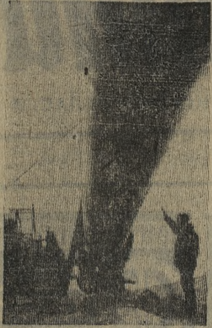
Кипит работа на 220-километровой трассе советского участка газопровода Иран-СССР...

Линия будет подключена к трансиранскому газопроводу в этом году. Из Ирана в СССР ежегодно будет транспортироваться 10 миллиардов кубометров газа.