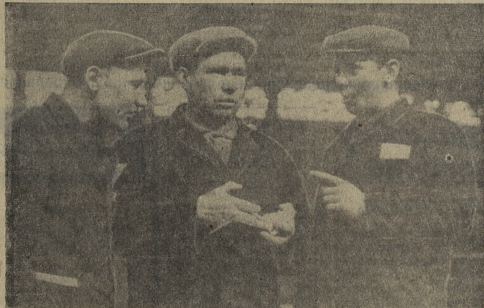
Активно участвуют в общественном смотре «Знать экономику, хозяйствовать рачительно» группа народного контроля первого цеха Новотрубного завода. Она проводит рейды-проверки организации труда, всегда ищет пути наиболее рационального использования рабочего времени.