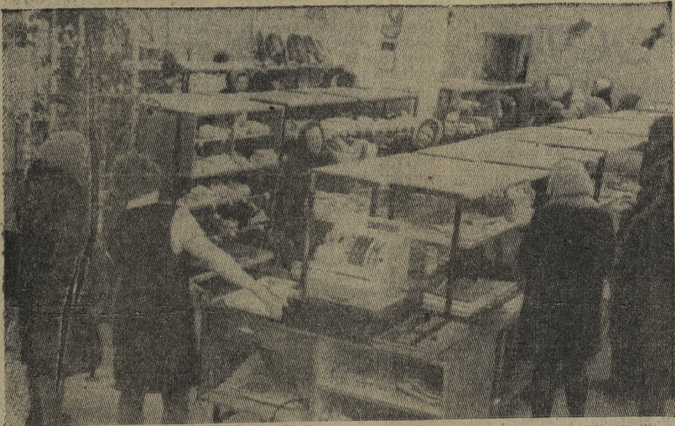
Магазин № 23 «Галантерея» перешел на работу по принципу самообслуживания по линейной системе. Надо сказать, что это третий магазин такого типа по Союзу. Два подобных есть в Виннице и Воскресенске. Достоинство такого вида торговли уже оценено покупателями. Здесь можно быстро сделать необходимую покупку, предварительно посмотрев ее.