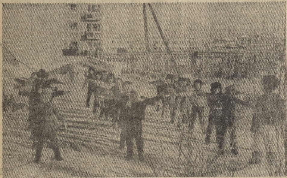
Детский сад № 72. Так начинается знакомство с физкультурой.

27 декабря новотрубники встретятся с московским «Фили», а уже следующий матч проведут в Первоуральске.