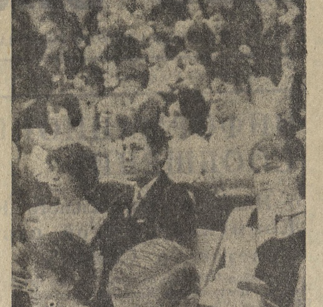
Делегаты конференции в большом зале Дворца культуры металлургов.

Важным фактором трудового воспитания являются субботники и воскресники. Первичные организации провели 1720 субботников, отработав на благоустройство и озеленение города, на строительстве 162 тысячи человеко-часов. Собрано 9700 тонн металлолома, высажено более 10 тысяч деревьев и кустарников. Однако мы не можем сказать, что все комсомольцы принимали активное участие в субботниках и воскресниках. Наша работа еще не приводит к желаемым результатам. В прошлом году не выполняли нормы 265 молодых рабочих, иначе — 238. Увеличилось число нарушений трудовой дисциплины. Все эти факты требуют от комсомольских организаций серьезного улучшения индивидуальной работы с каждым юношей, каждой девушкой.