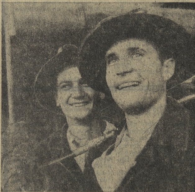
БОЛГАРИЯ. Эти молодые металлурги трудятся на комбинате цветных металлов близ Пловдива.