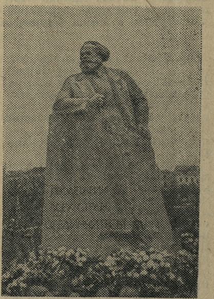
МОСКВА. Памятник Карлу Марксу.

Несколько часов длились праздничные торжества в сердце нашей Родины — Москве. Они явились ярким свидетельством единства и сплоченности трудящихся вокруг родной Коммунистической партии, ведущей великий советский народ к сияющим вершинам человеческого счастья. Трудящиеся Москвы показали свое неукротимое стремление к миру, к дружбе со всеми народами земли, заявили о своей готовности отдать все силы на построение самого справедливого общества — коммунизма.