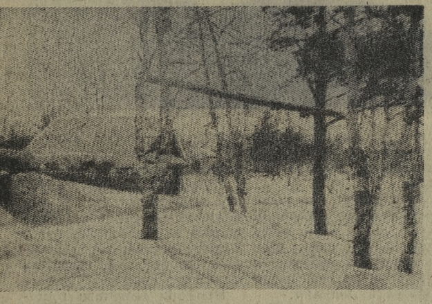
Снегопад прошел. Пережело пути-дороги, а здесь, на окраине Коуровки, узенькие тропинки и вовсе еле заметны. Вот как решительно заявила о своем приходе зима.

ПРИ ОТСУТСТВИИ ТЯГИ В ДЫМОХОДЕ КОЛОНКУ НЕ ВКЛЮЧАЙТЕ, ПОКА ДОМОУПРАВЛЕНИЕ НЕ ПРОИЗВЕДЕТ ОЧИСТКУ ДЫМОХОДА. Трест Первоуральскмежрайгаз. ПРИХОДИТЕ ЗВОНИТЕ ПЛАЧУТЕ ПО АДРЕСУ: г. Первоуральск, проспект Ильича, 21/40. ТЕЛЕФОНЫ: редактор — 2-15-72, зам. редактора — 2-52-05, ответственный секретарь — 2-14-94, отдел партийной жизни — 2-52-83, экономический отдел — 2-52-21, отдел писем — 2-52-71, бухгалтер — 2-53-71, директор типографии — 2-46-55.