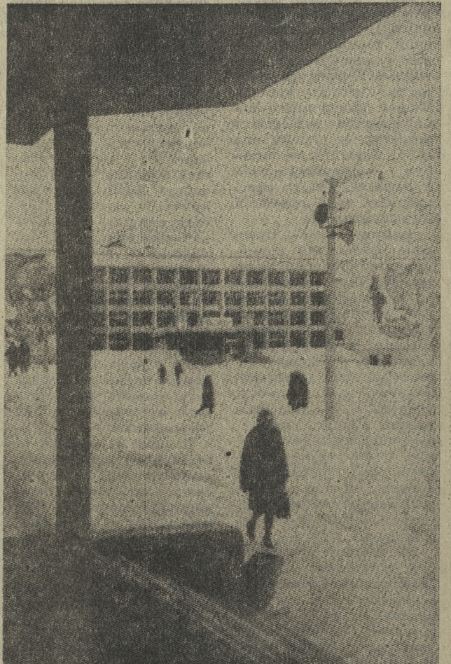
Гордятся первоуральцы своим городом. Он хорошеет из года в год. Почти по 50 тысяч квадратных метров благоустроенной жилой площади получают ежегодно от строителей металлургии, химии, горняки и машиностроители. Сооружаются в городе и культурно-бытовые учреждения. НА СНИМКЕ: вид на Дворец культуры Новотрубного завода.

Выяснилось, что свою роль шефа над Битимским, Слободским и Пильнинским очагами культуры руководители Дворца культуры Новотрубного завода сводят лишь к равным концертам. Не изучают запросов сельского населения. Комиссия рекомендовала руководителям городских дворцов, домов культуры и клубов организовать учебу работников сельских культпросветучреждений, помогать им в организации коллективов художественной самодеятельности, в проведении интересных вечеров отдыха трудящихся.