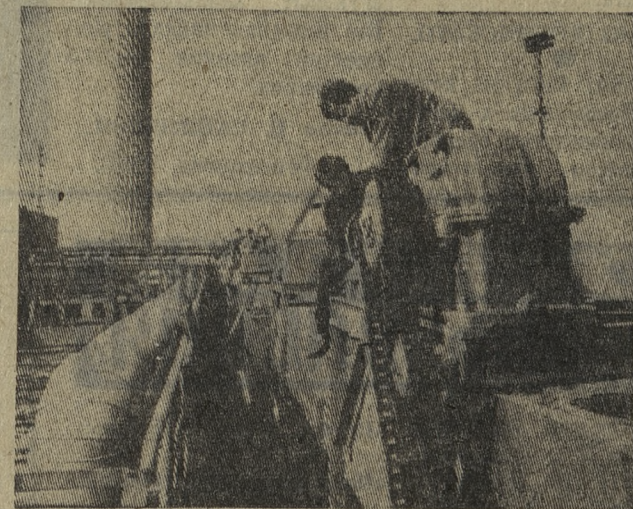
ЧЕХОСЛОВАКИЯ По-ударному работают строители, готовящие и сдаче новый сахарный комбинат в словацком городе Дунайская Страда. До конца сезона сахароварения коллектив этого предприятия отгрузит 40—50 железнодорожных составов сахара.

В. ПОСКОТИНОВ, технорук первого цеха динасового завода.