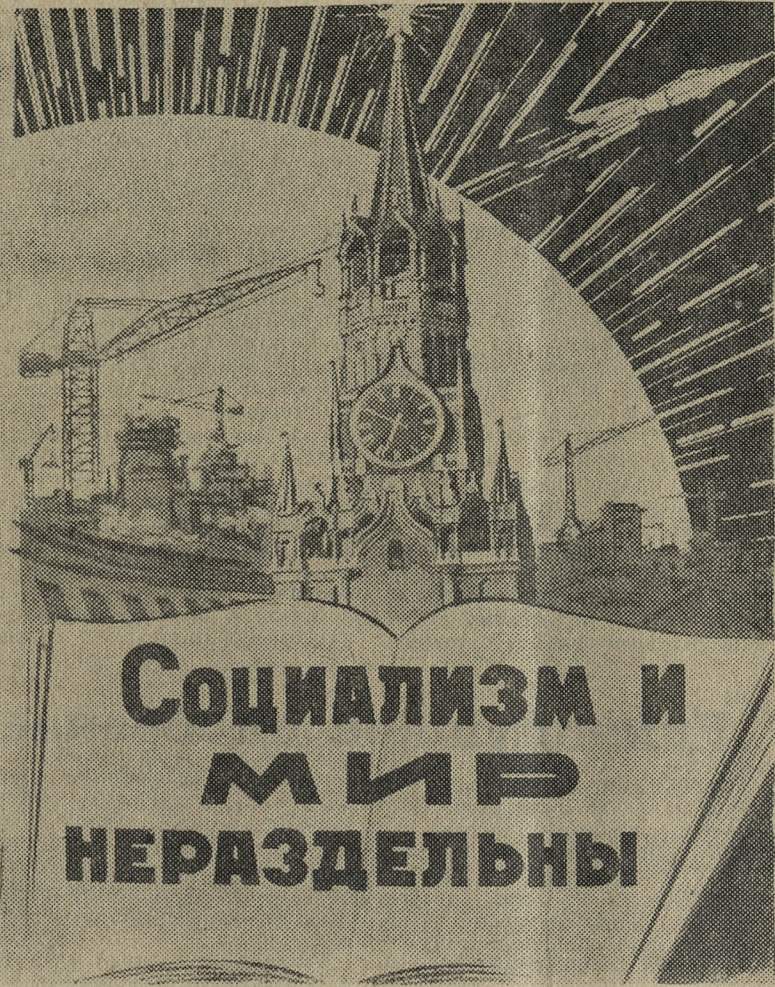
Плакат художника Б. Антонова.

«ПОД ЗНАМЕНЕМ ЛЕНИНА» 2 стр. 5 ноября 1961 г.