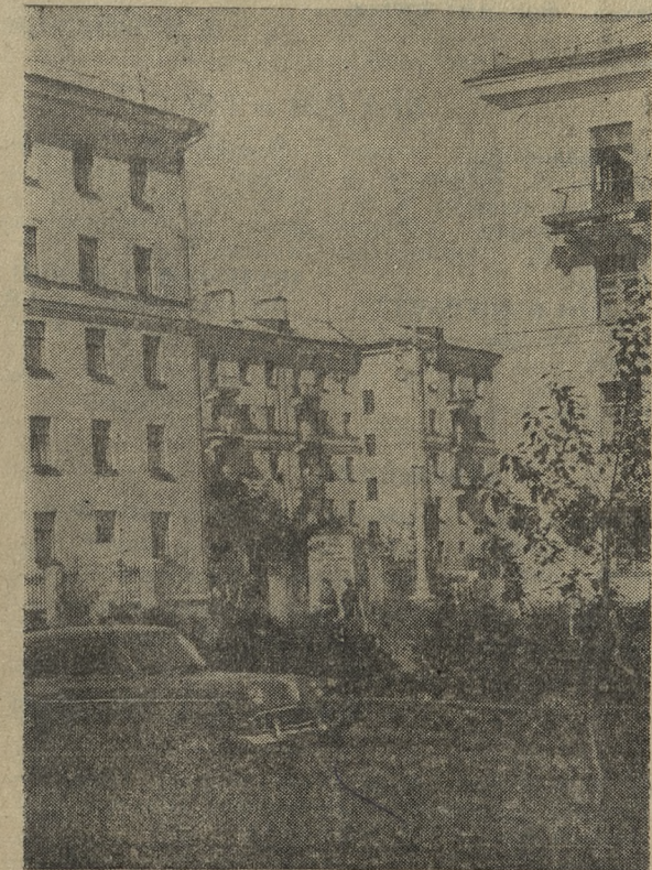
Уголок Соцгорода.

С КАЖДЫМ днем меняется лицо Старотрубного завода. Исчез прокатный цех, где производством труб осуществлялось вручную на старинных примитивных станах. Нет больше и старого мартеновского цеха с большим количеством ручного труда.