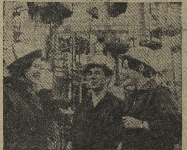
На крупнейшем в ГДР нефтехимическом комбинате «Лойна» имени В. Ульбрихта близ Галле трудится много молодежи. Большинство из них являются активными членами Общества германско-советской дружбы.

С речью на заседании выступил товарищ Л. И. Брежнев. По окончании