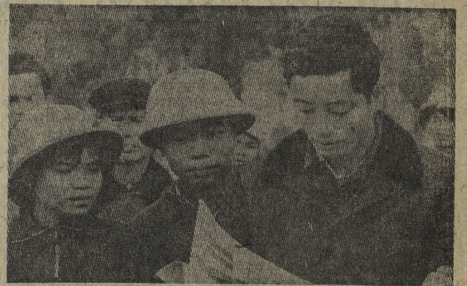
Жители Ханоя быстро раскупают тиражи столичных газет. Каждого интересуют новости о боях на Юге страны, вести о трудовых победах вьетнамского народа, сообщения о жизни братских социалистических стран.