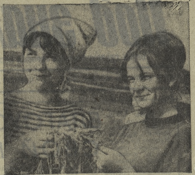
Сотни юношей и девушек, посланцев городской комсомольской организации, трудятся сейчас на полях подшефных совхозов Ачитского района. Только в совхозе «Заря» насчитывается свыше ста человек, которые заняты на силосовании, заготовке сена и даже на пахоте и севе озимых. А перед большой группой молодежи Ново-Трубоного завода поставлена задача — убрать урожай лука-севака с площади 35 гектаров.