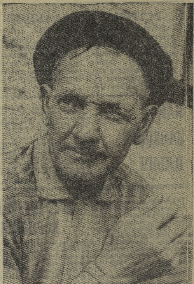
Годы, люди, судьбы

О войне рассказано много, но у каждого ее участника есть свои, известные только ему, странички воспоминаний. О них Василию Павловичу всякий раз напоминают раны — неза-