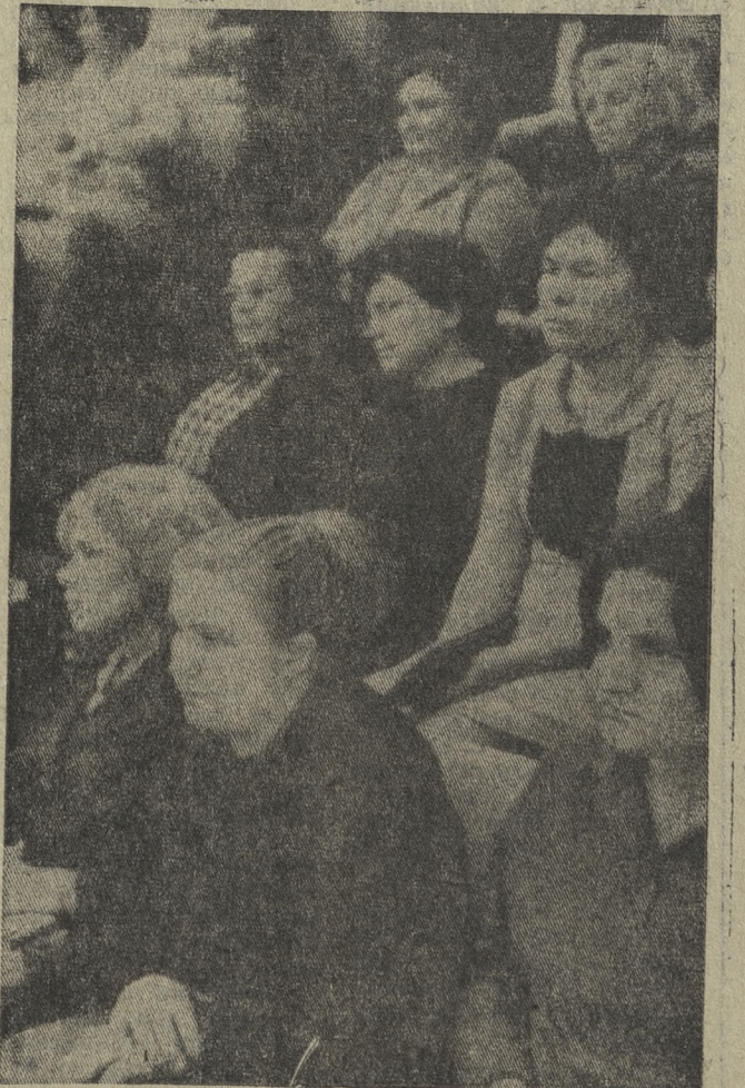
В зале совещания.