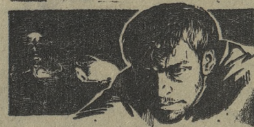
ЭКСПЕРИМЕНТ ДОКТОРА АБСТА

21 августа в кинотеатре «Восход» состоится торжественный киносеанс, посвященный 50-летию советского кино.