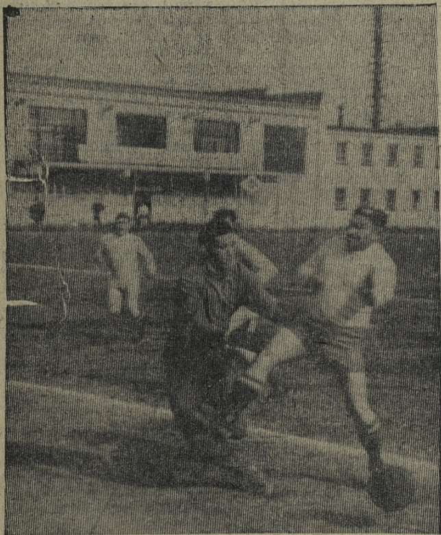
Спорту все возрасты покорны. Когда на футбольном поле хромикового завода встречаются команды цеховых коллективов, рядом со вчерашними десятиклассниками можно увидеть ветерана труда. На нашем снимке: матч между командами шестого и седьмого цехов.

Заявления и документы (аттестат об образовании, свидетельство о рождении в подлиннике, 6 фотографий 3х4, справка о состоянии здоровья, справка о зарплате родителей, справка с места жительства, автобиография, характеристика из школы) принимаются до 10 августа 1969 года по адресу: пос. Билимбай, ул. Ленина, 140.