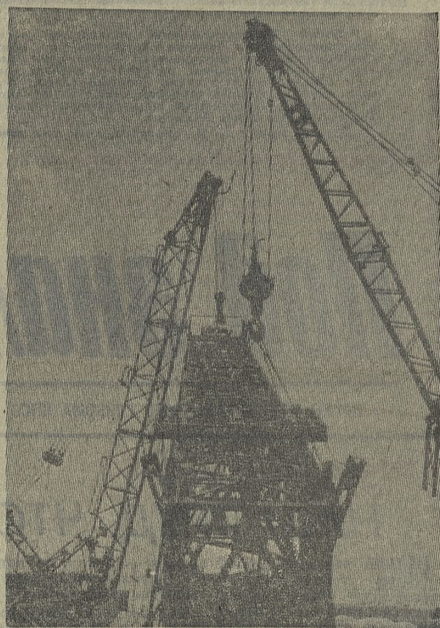
Фотообъектив корреспондента Н. БУДЫГИНА уловил интересный момент: подъем козлового крана на складе Уралстальконструкции.