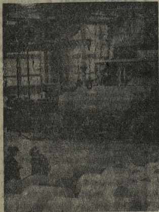
АРХАНГЕЛЬСК. Выработать к концу года сорти миллионов квадратных метров бумаги сверх плана — такое обязательство взяли коллективы фабрик Архангельского целлюлозно-бумажного комбината.

На снимке: в одном из цехов бумажной фабрики № 2.