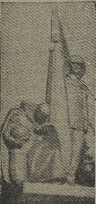
На средства трудящихся города воздвигнут этот памятник в парке культуры и отдыха.