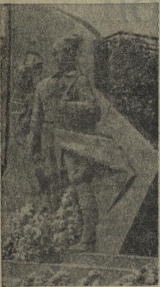
В зелени деревьев летом, в пушистых от инея ветвях зимой высечен из камня барельеф возле хромпикового завода.