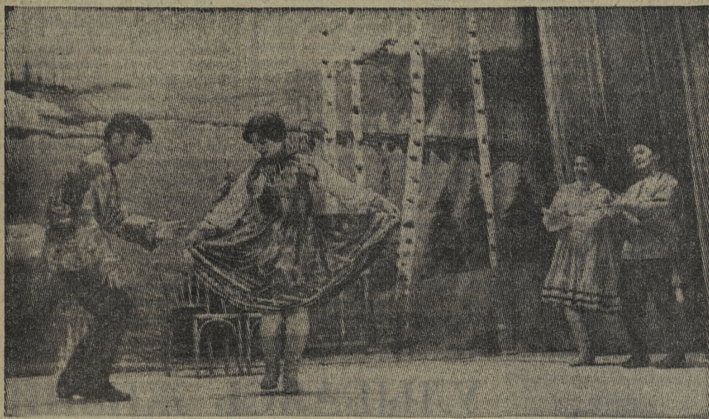
Идет заводской смотр. Выступает танцевальная группа художественной самодеятельности клуба имени В. И. Ленина хромпиковцев.