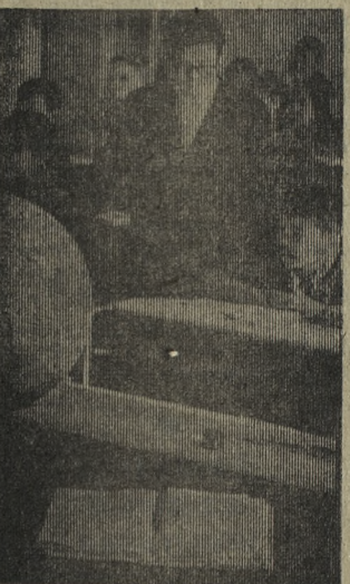
ХАВАРОВСКИЙ КРАЙ. Около 300 ребятишек — нанайцев, ульчей, нивхов, русских, украинцев — живут на полном государственном обеспечении в интернате и учатся в школе села Найхин Нанайского района. Многие учителя — коренные жители здешних мест, получившие высшее образование в вузах страны. Один из них Геннадий Бельды, который ведет этот урок (на снимке).