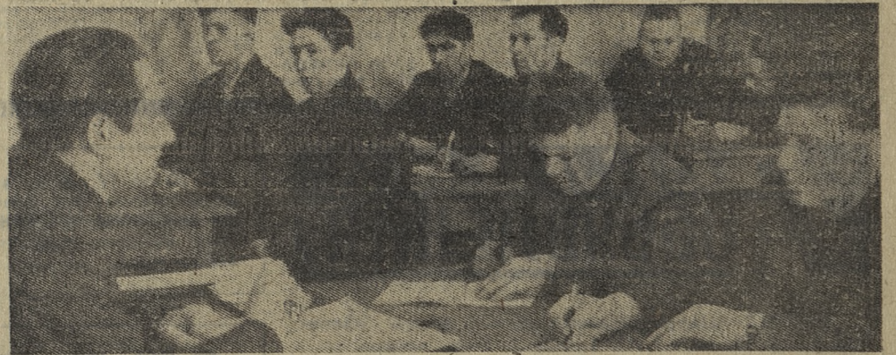
На Старотрубном заводе при кабинете техучебы открыты курсы по повышению квалификации кольцевых.