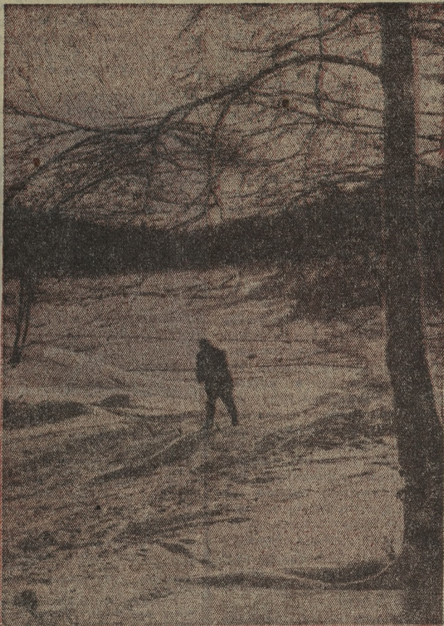
Красивая местность окрест базы отдыха «Бодрость» Новотрубного завода. Зимой разбегаются по ней змейки лыжи. За 1968 год 75 тысяч гостей побывало на «Бодрости». Нынче зима суровая, но никакой мороз не останавливает городских спортсменов.