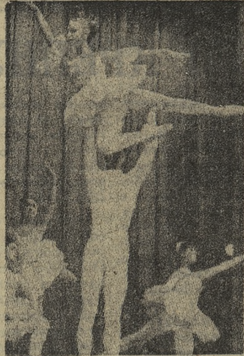
Балетная студия Дворца культуры металлургов исполняет хореографическую сюиту «Времена года» на музыку П. И. Чайковского.