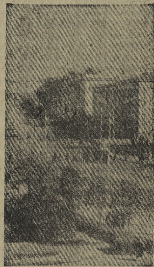
Столица республик Минск. Ленинский проспект.