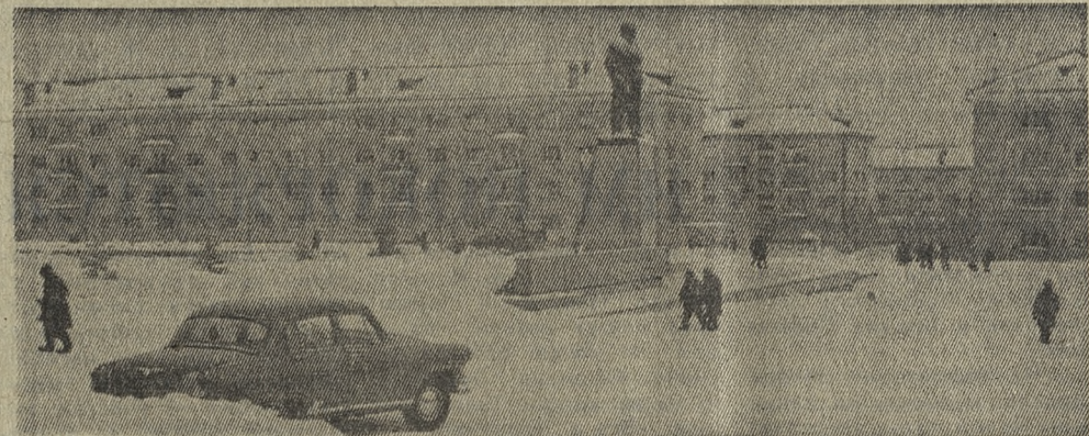
Главная площадь города зимой.