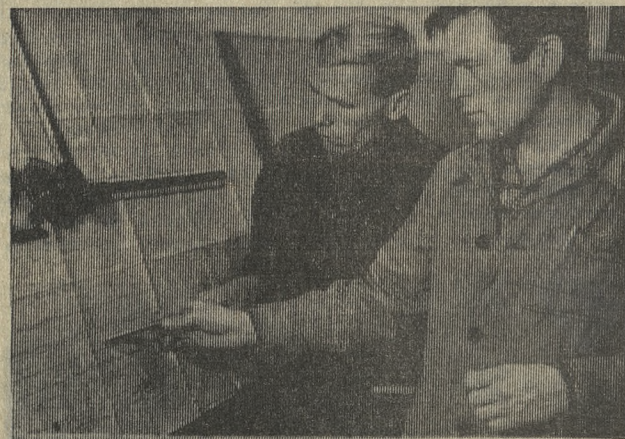
В дни подготовки к 50-летию Ленинского комсомола на хромпиковом заводе с большим успехом прошел смотр технического творчества молодых. В нем участвовало 135 рационализаторов, которые помогли сберечь государству десятки тысяч рублей.

В. ВИРАЧЕВ, ответственный секретарь правления городской организации «Знание».