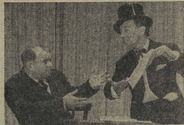
Выступает агитбригада «Протяжка».

«Протяжка» старотрубников давно стала популярной на заводе. По сравнению с прошлым годом на много выросла. Она на-