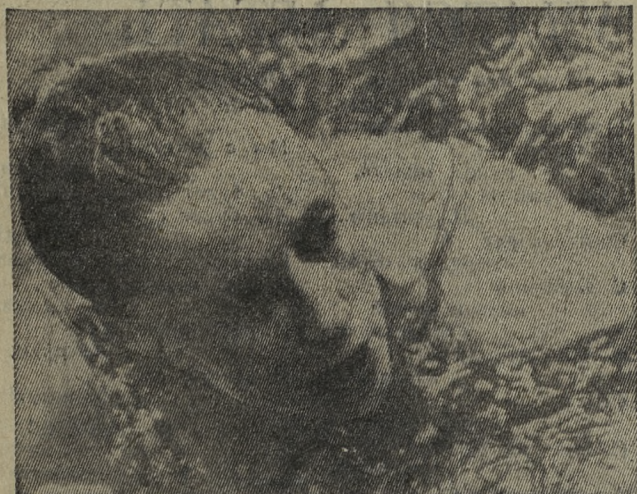
Наши болельщики надеются, что свое слово скажет известная советская пловчиха Галина Прокуменчикова.

об истории олимпийского движения. Начиная с аэропорта, везде встречаешь внимательное отношение к человеку с олимпийским знаком в петлице, будь то наш зеленый знак прессы или какой-либо другой. 400 автобусов, обслуживающих олимпийцев, движутся по модернизированным автострадам мексиканской столицы на более высоких скоростях, чем обычный транспорт. Их сопровождает полицейский эскорт, и таким автобусам обеспечивается «зеленая улица». Нам сказали, что для экстраординарных случаев организаторы располагают даже вертолетами.