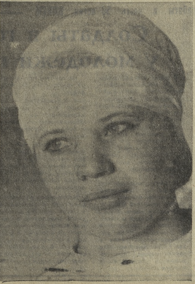
Г. КОСТИН.

Каждая с честью несет эстафету, переданную хлеборобами.