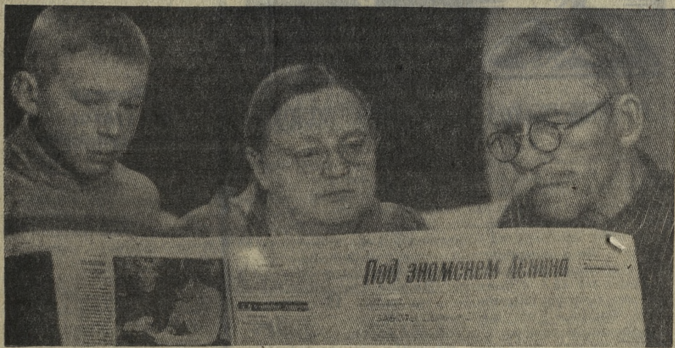
И дедушка с бабушкой, и внук нашли для себя интересное.