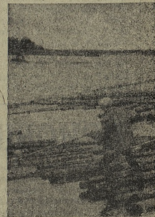
НА СПЛАВНЫХ рейдах Севера Тюменской области заканчивается навигация. Отлично потрудились в этом году ханты - мансийские сплавщики. Перевыполнив восьмимесячный план, они отправили вострокам, предприятиям страны 1,250 тысяч кубометров сибирского леса.

На снимке: в гавани рейда Выкатное Ханты-Мансийской сплавной конторы.