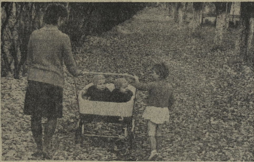
Октябрь уж наступил.