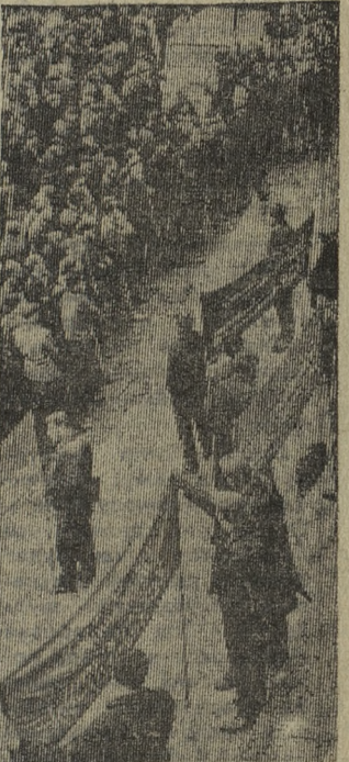
ФИНЛЯДИЯ. «Работу — рабочим, дома — нуждающимся!» — под таким лозунгом состоялась массовая демонстрация безработных строителей перед зданием парламента в Хельсинки.