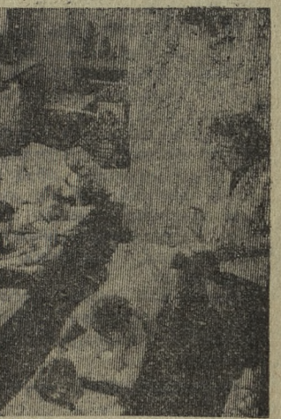
ЗАБОТА о подрастающем поколении — задача первоочередной важности для государства немецких рабочих и крестьян. Почти половина всех детей Германской Демократической Республики в возрасте от 3 до 6 лет ходит в детский сад, каждый шестой ребенок получает место в яслях.