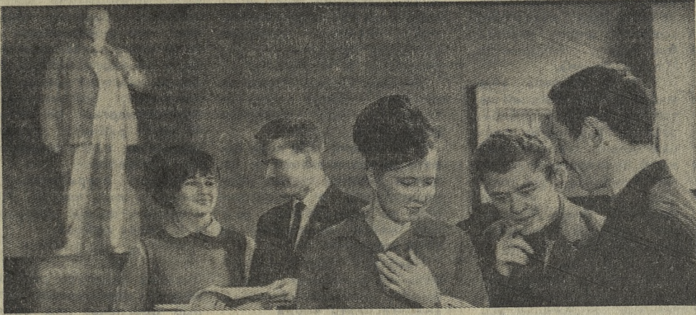
Казанский государственный университет имени В. И. Ульянова-Ленина. Студентом в 1887 году был Владимир Ильич. Сейчас это одно из крупнейших в стране высших учебных заведений. В его стенах учился 10 тысяч студентов тридцати двух национальностей.