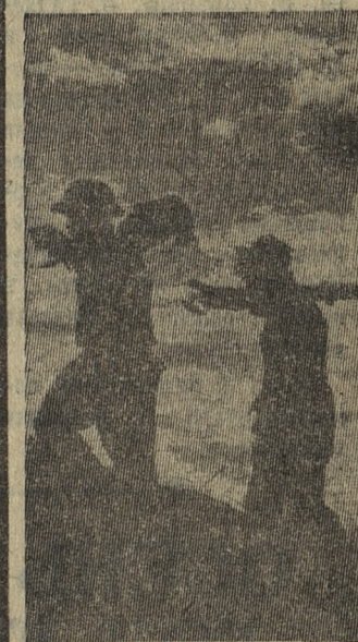
Южновьетнамские патриоты в походе.