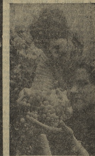
Венгрия — страна садов, виноградников, овощеводческих хозяйств. Увеличение занимаемой ими площади, рост урожайности способствуют расширению экспорта. Потребителями венгерских овощей, фруктов, консервов являются 20 стран мира. Крупнейший покупатель — Советский Союз. На снимке: чудесный столовый виноград созрел на плантациях сельскохозяйственного кооператива «Голубой Дунай» близ Будапешта.