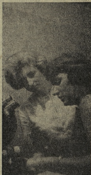
НОВОСИБИРСК. В институт геологии и геофизики Сибирского отделения Академии наук СССР возвращаются первые экспедиции разведчиков недр. Впереди — кропотливый период лабораторной обработки материалов.

В лаборатории рентгено-спектрального анализа установлен электронный микроскоп, который с большой точностью определяет химический состав геологических образцов.