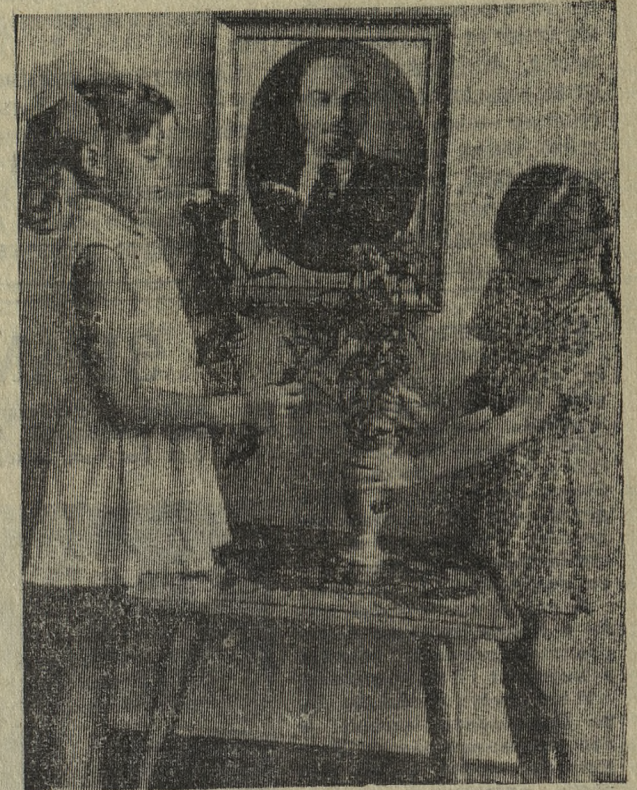
Цветы дедушке Ленину.

Для примера мы возьмем не те короткие походы, в