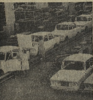
УДМУРТСКАЯ АССР. Ижевский автомобильный завод — ударная стройка пятилетки. На возведении его корпусов трудятся комсомольцы и молодежь из многих областей и республик страны. Завод строится и одновременно выпускает продукцию. Сотни «Москвичей» Ижевской марки уже мчатся по дорогам нашей необъятной Родины. На снимке: конвейер бегового кузова.