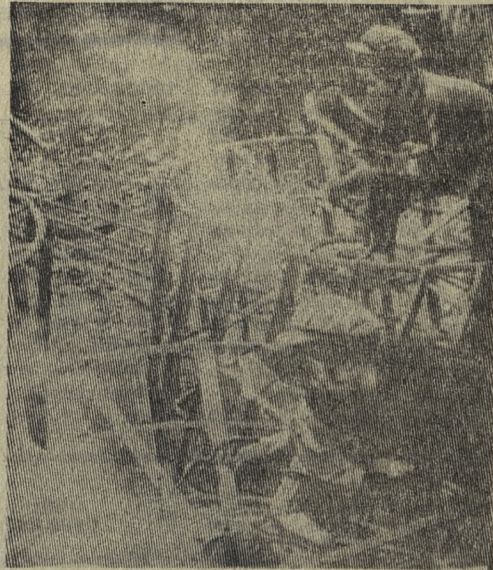
На снимке слева: остатки трехтысячного американского самолета, сбитого отважными зенитчиками Вьетнамской народной армии.