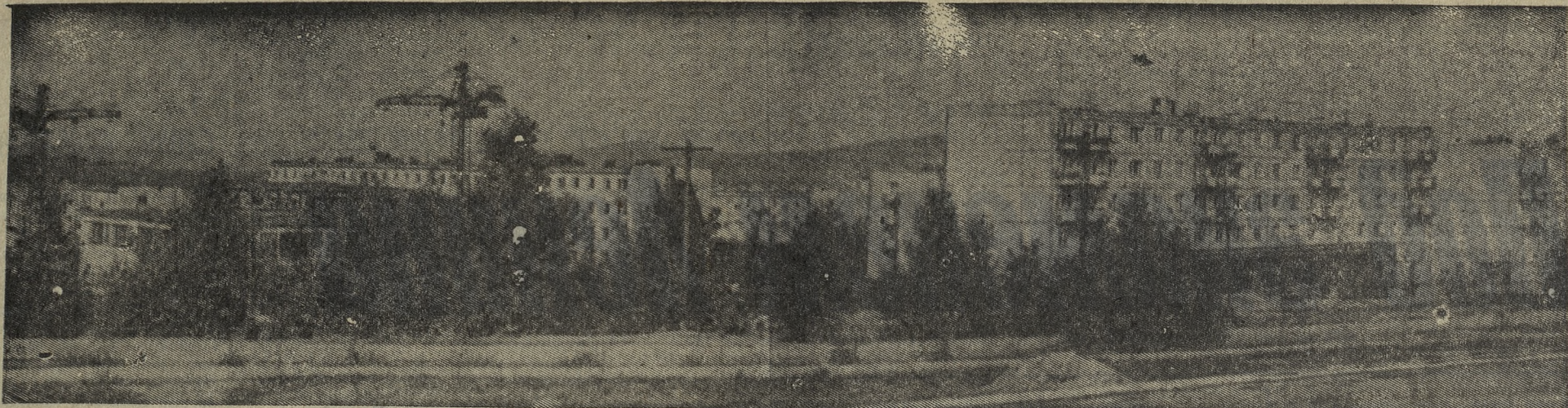
НОВОЕ ЛИЦО СТАРОГО ТЕХГОРОДА.