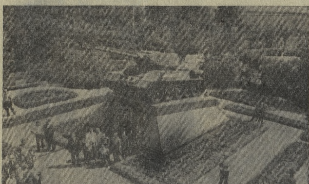
БЕЛГОРОДСКАЯ ОБЛАСТЬ. В мемориальном парке героев битвы на Курской дуге висит на постаменте