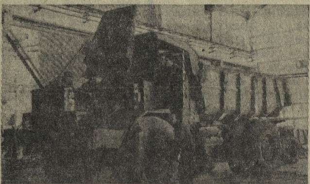
В МОЛОДОМ таджикском городе Орджоникидзебаде вступила в строй первая очередь самого мощного в Средней Азии ремонтно-механического завода Министерства