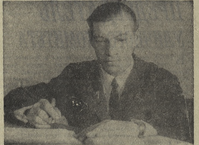
Коммунисты и Устав КПСС

Л. НЕЗЛОБИН, общественный корреспондент.