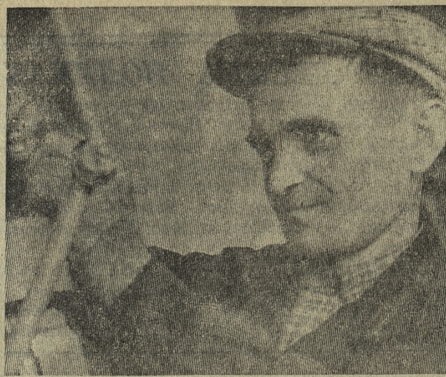
СОЮЗ НАУКИ И ТРУДА