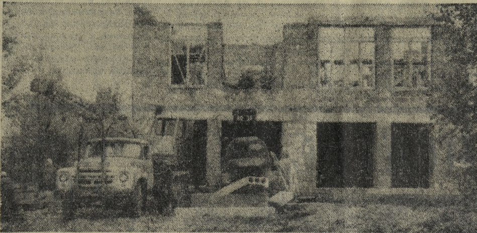
На берегу Билимбаевского пруда металлзавод выстроил базу отдыха для своих трудящихся. Сейчас там возводится зимний корпус.

Л. СТУЛИНА, экономист фабрики бытового обслуживания им. 1 Мая.