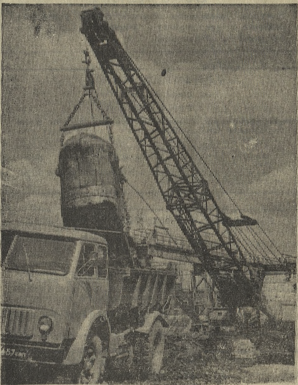
Ведется реконструкция волочильного цеха на Старотрубном заводе, причем без остановки его. После реконструкции выпуск тянутых труб значительно возрастет. Генеральный подрядчик — первое управление треста Уралтяжтрубострой.