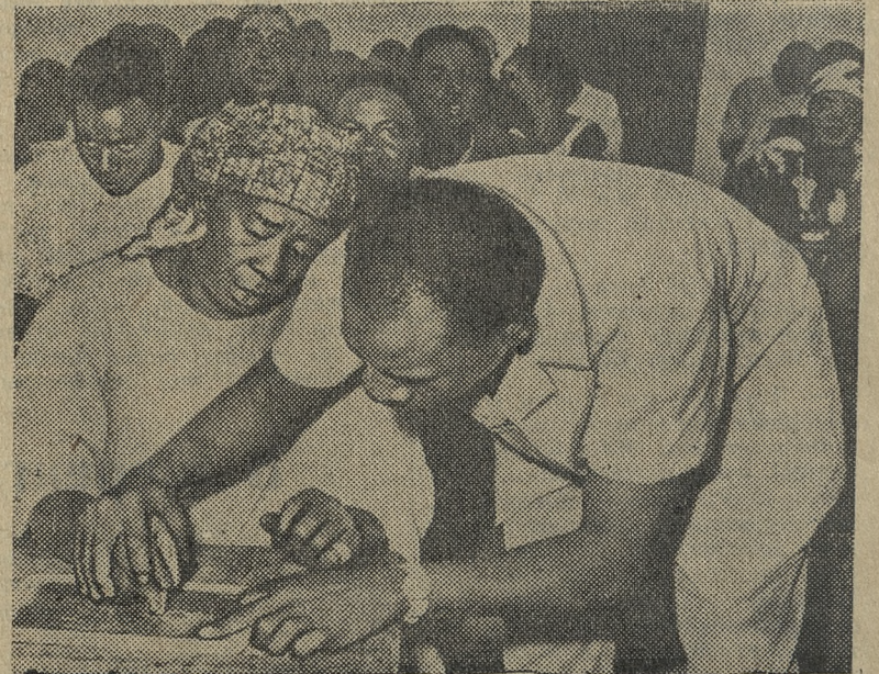
Зам. редактора А. ТИМОШИН.

Отдел культуры горисполкома сегодня в 10 часов утра проводит семинар всех заведующих клубами в помещении отдела культуры при горисполкоме. Явка всех заведующих обязательна.