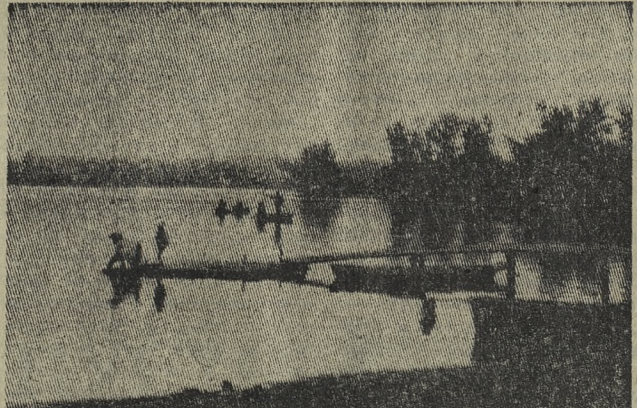
Красив берег городского пруда летом: старые кряжистые тополя подошли к самой воде, бросая на нее пестрые причудливые тени. Устроившись в лодках, любят рыбаки встречать с удачной утренней зорькой. Богатство природы, свежесть ее и красота приносят человеку немало радости, здоровья и хорошего настроения, и умение сберечь ее дары оплачивается с лихвой. Фотозвезд П. КИРПА.

территорию тополями, а ведь это не лучший посадочный материал. Пройдет несколько лет и каждым летом дорожки сада будут захламлены тополиными семенами и почками. На участке новой школы № 6 этой весной высадили старые яблони, березы, не пригодные к посадке кусты смородины. А лучше было взять молодые саженцы из питомника и заложить фруктовый сад. Сами школьники вырастили, сохранили бы его. Не лучше выглядит и территория школы-интерната. Где, как не здесь разбить сад, а не продолжать садить тополю.