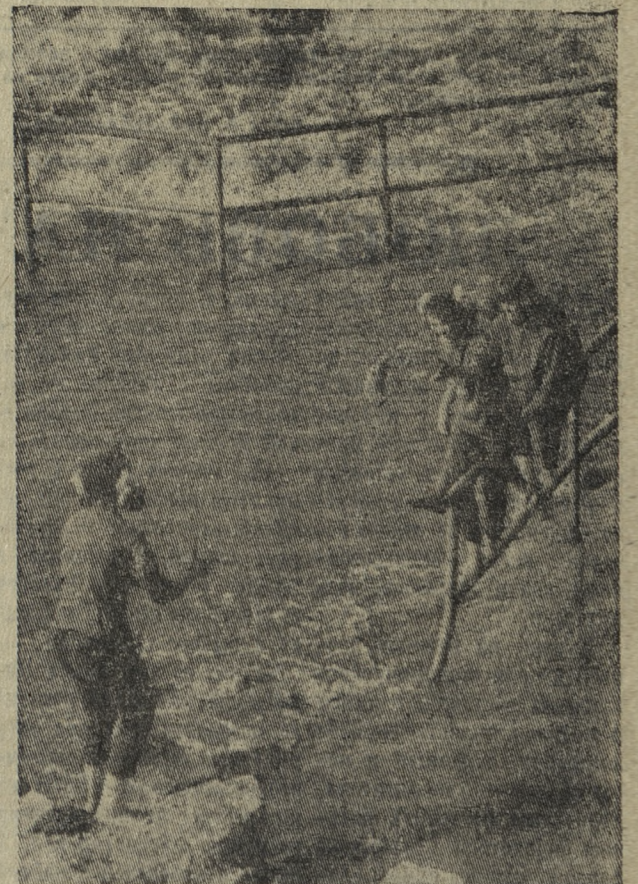
Отважные девчонки.