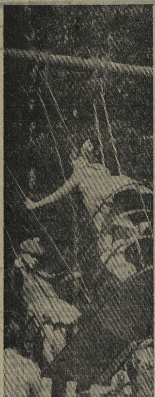
Все выше и выше взлетают начли к самым верхушкам сосен — дух захватывает и немножко страшно. Но желающих покататься много, и они терпеливо ждут своей очереди.

С. БИЛИНКИС, заместитель главного врача медсанчасти хромпикового завода.