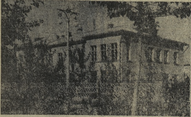
Многие уголки Соцгорода утопают летом в зелени и цветах.