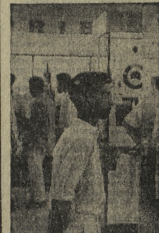
КАРАЧИ (Пакистан). По знаменитой пакистанской фирме и государственной организации с советской аппаратурой и точными приборами — танова цель открывшейся в Карачи специализированной Выставке советских приборов и аппаратуры, организованной здесь В/О «Машприборинторг».

Тысячи пакистанцев ежедневно посещают выставку: здесь представители фирм, научно-исследовательских учреждений, специалисты, просто любители радио, телевидения, фотоаппаратуры. На снимке: общий вид выставки.