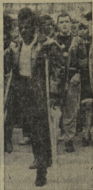
США. Первые участники похода бедняков уже вступили в Вашингтон, а по дорогам Америки и столицы продолжают двигаться новые тысячи обездоленных. На снимке: одна из колонн участников похода бедняков.