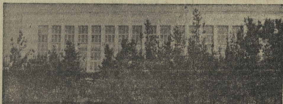
Сквозь темно-зеленую крону молодых сосен видно огромное здание Дворца спорта, где круглый год хозяевами будут конькобежцы, фигуристы и любители хоккея. Заканчивается сооружение крытого катка, благоустраивается территория вокруг здания.