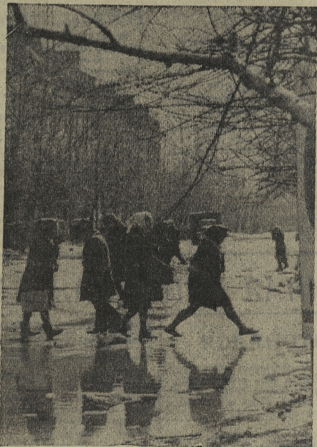
Весна на улицах.